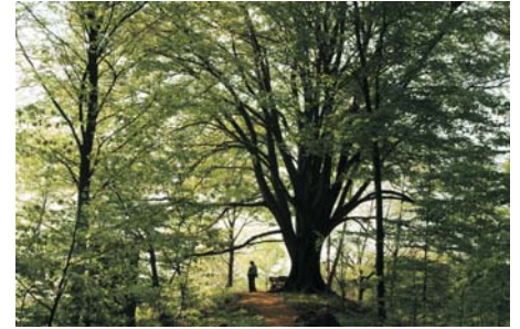
alte Buche am Dohrenberg

andere Sinne wird etwas geboten: Thymian und Wacholder duften, die Heuschrecke summt und die Dorngrasmücke singt.