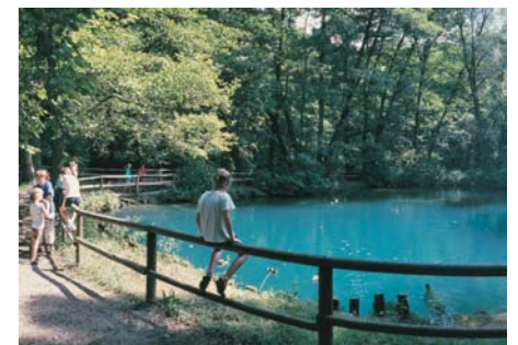
Rhumequelle bei Rhumspringe

Um ein gut abgerundetes touristisches Angebot für die Rhume zu erhalten, müssen neben der Gewährleistung der Befahrbarkeit und dem Vorhandensein von Bootsverleihen auch Ein- und Ausstiegspunkte eingerichtet werden sowie Transportmöglichkeiten der