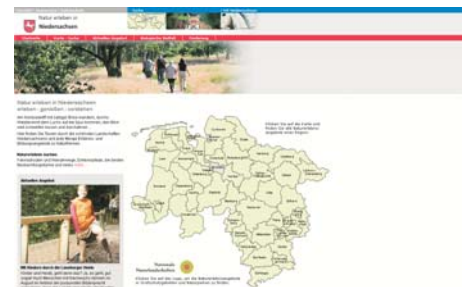
nds. Website zu "Natur erleben"

Projekte abgeschlossen, wie z.B. Wander- und Lehrpfade in der Lüneburger Heide, aber auch Projekte in Stadtregionen wie Braunschweig.