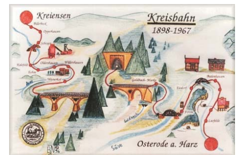
Zeichnung der Kreisbahn Osterode - Kreiensen

Kleinbahntrasse der ausgeschilderte Rad- und Wanderweg "Kirchen und Kapellen", der gut in eine zu erweiternde Themenroute miteingebunden werden kann.