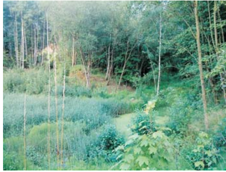
überwucherte Tongrube von Willershausen

logie der Universität Göttingen ein Ausstellungenskonzept für die Funde. Mögliche Pflegemaßnahmen in der Tongrube und im Eingangsbereich, Wegelenkung, Räumlichkeiten, Gutachten der Naturschutzbehörde und überregionale Vermarktung des Naturdenkmals sind Themen, geklärt werden müssen - und die das Vorhaben zu einem interdisziplinären und anspruchsvollen Projekt macht. Es ist gut, dass für die Teilprojekte Fachleute wie die