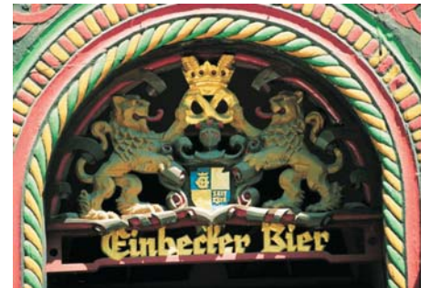
Eingang zum Brodhaus

Darüber hinaus kann man die vielfältige Vogelwelt am Leinepolder erleben oder durch die Tal-Auen radeln. Nicht nur den Menschen